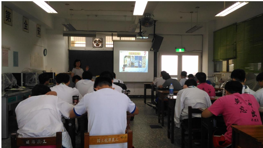
柴浣蘭系主任解說環工系課程特色(圖三)