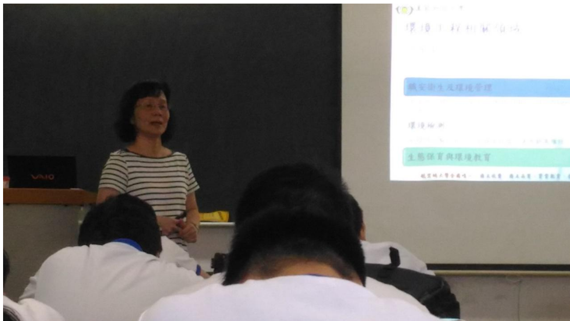
柴浣蘭系主任解說環工系課程特色(圖四)