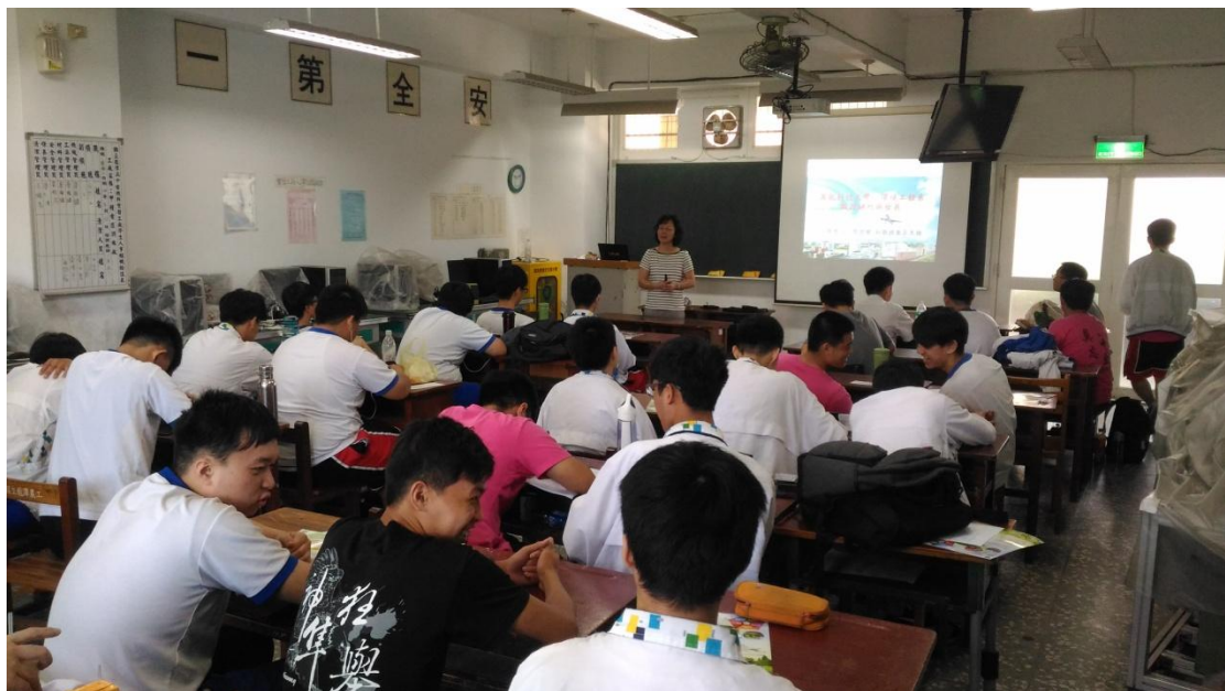
柴浣蘭系主任 與同學互動交流研討(圖六)