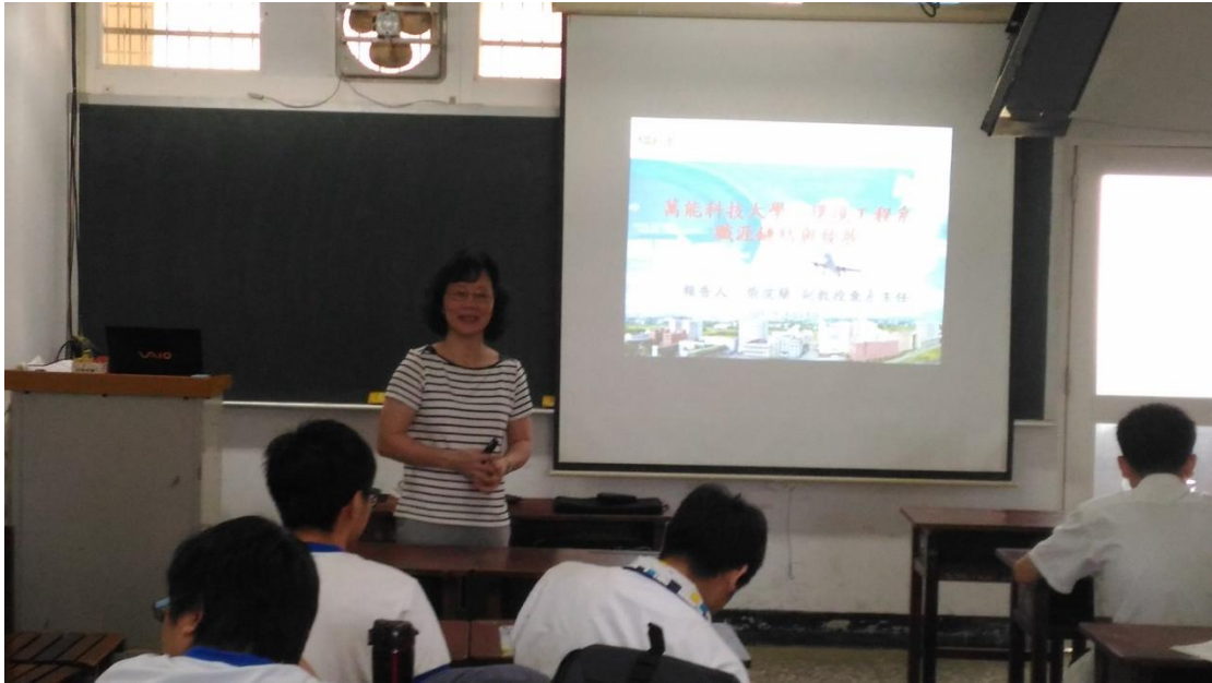
柴浣蘭系主任解說環工系課程特色(圖一)