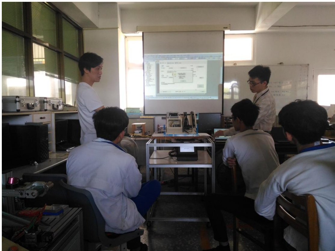
研習活動照片十一