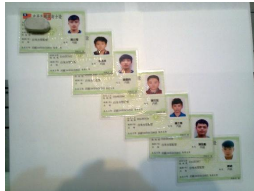
(7 個人全數通過， 及格率 100%)