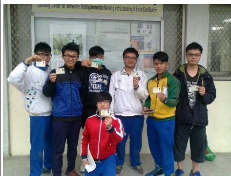
(學科測試結果—全部高分通過 全部取得技術士證照)