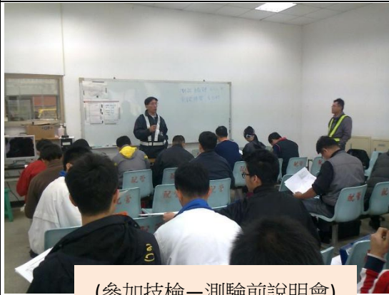
(參加技檢—測驗前說明會)