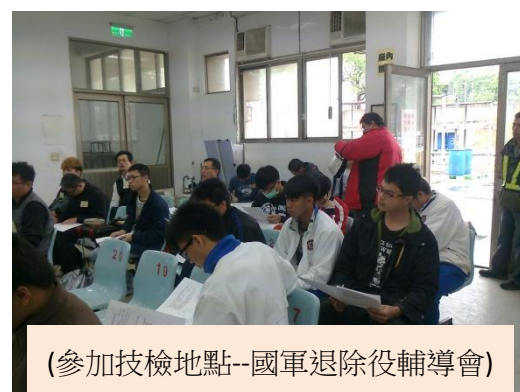
(參加技檢地點--國軍退除役輔導會)