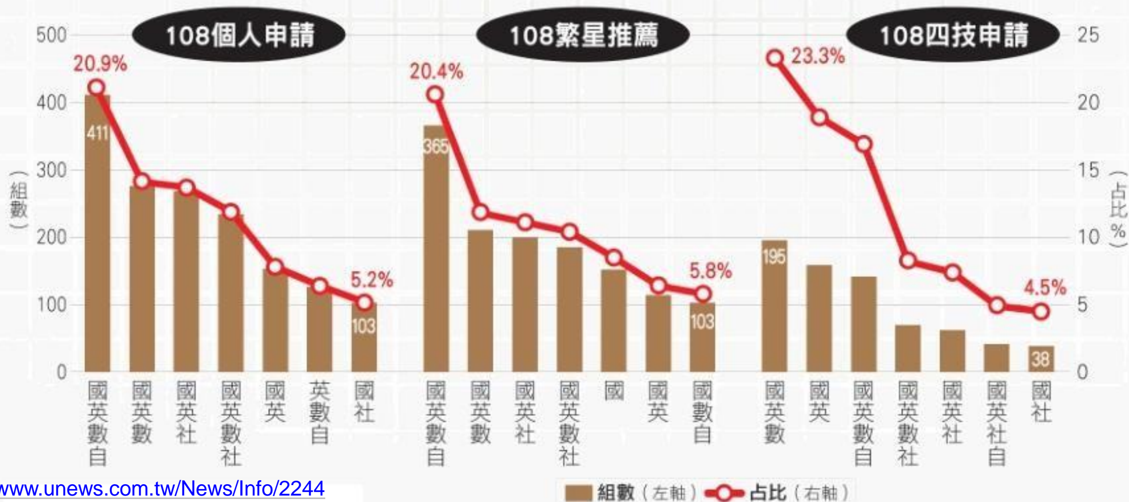
參採科目國、英、數占比高