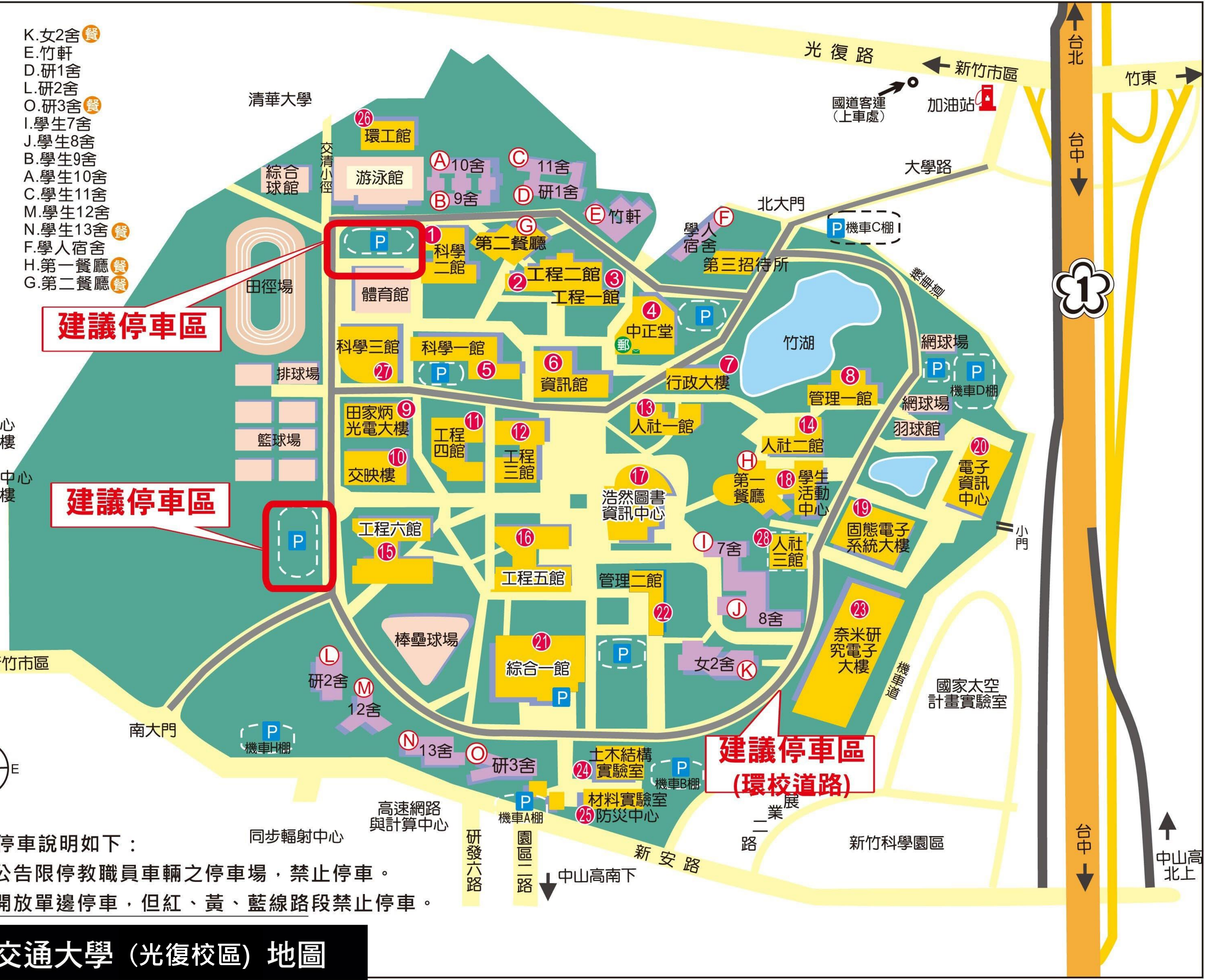
國立陽明交通大學（光復校區）地圖

本校汽車停車位停車說明如下： 1.藍色停車格及公告限停教職員車輛之停車場，禁止停車。 2.環校道路外圈開放單邊停車，但紅、黃、藍線路段禁止停車。