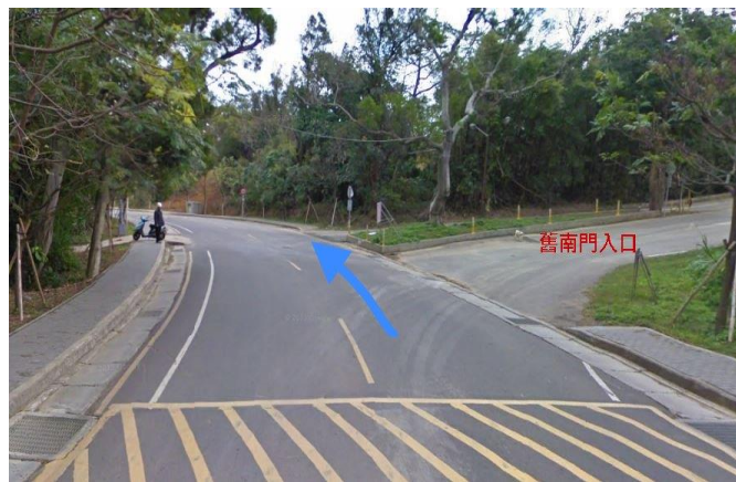
2. 育成創新大樓→ 舊南門入口