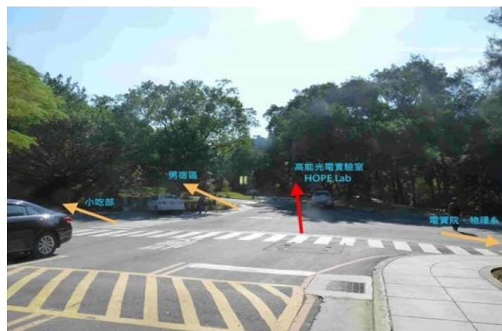
|3 圖書館→野台(小吃部旁) |