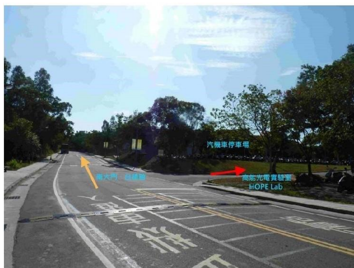
|7 荷塘→奕園汽機車停車場|