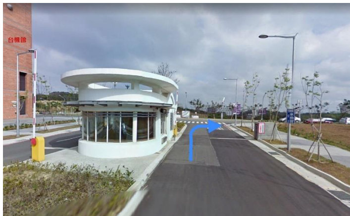
1. 南門口→右轉 育成創新大樓