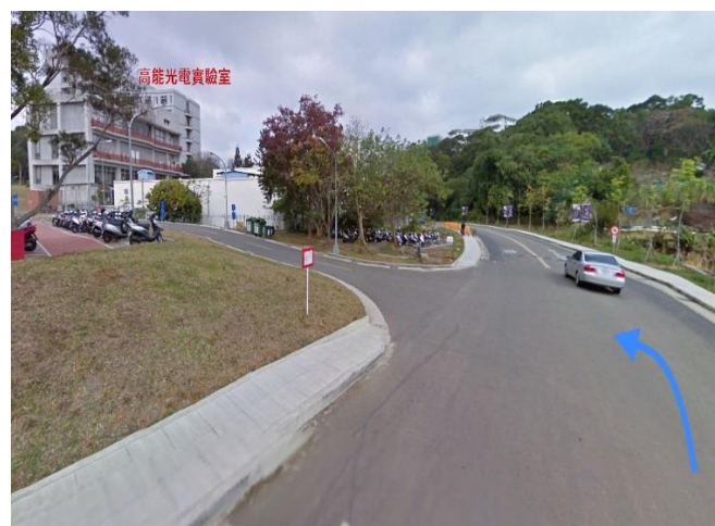
4. 南校區廢水處理廠 →左轉 奕園停車場