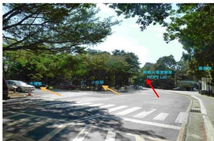
|2 綜合一館→圖書館 |