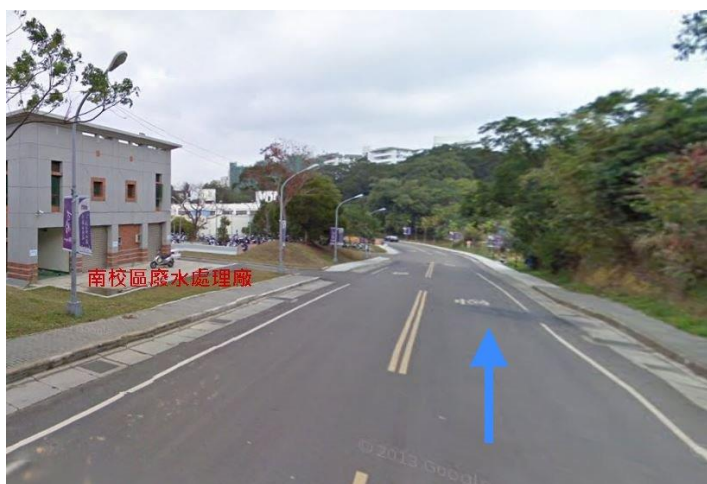
3. 舊南門入口→南校區廢水處理廠