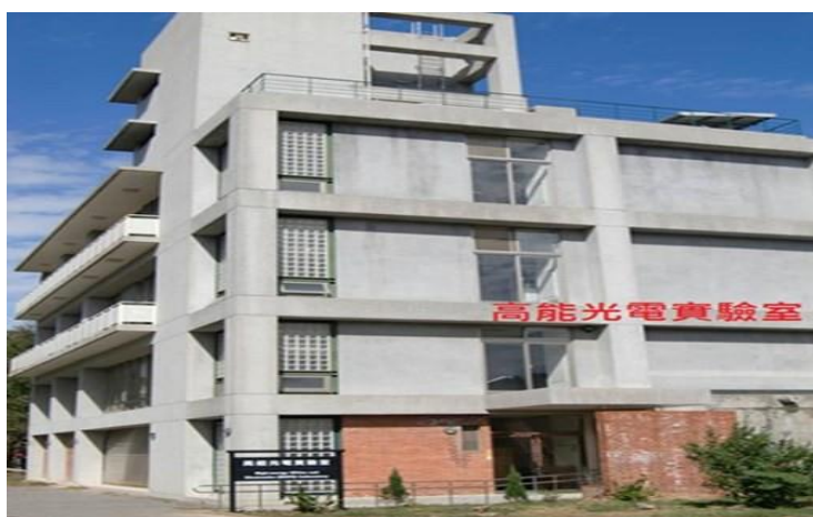
5. 奕園停車場→高能光電實驗室