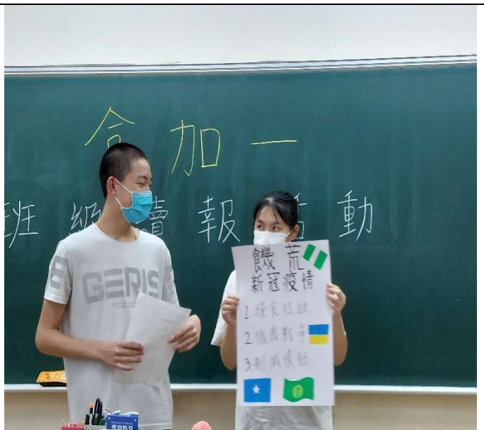
照片說明：班級分組共讀報紙(三)